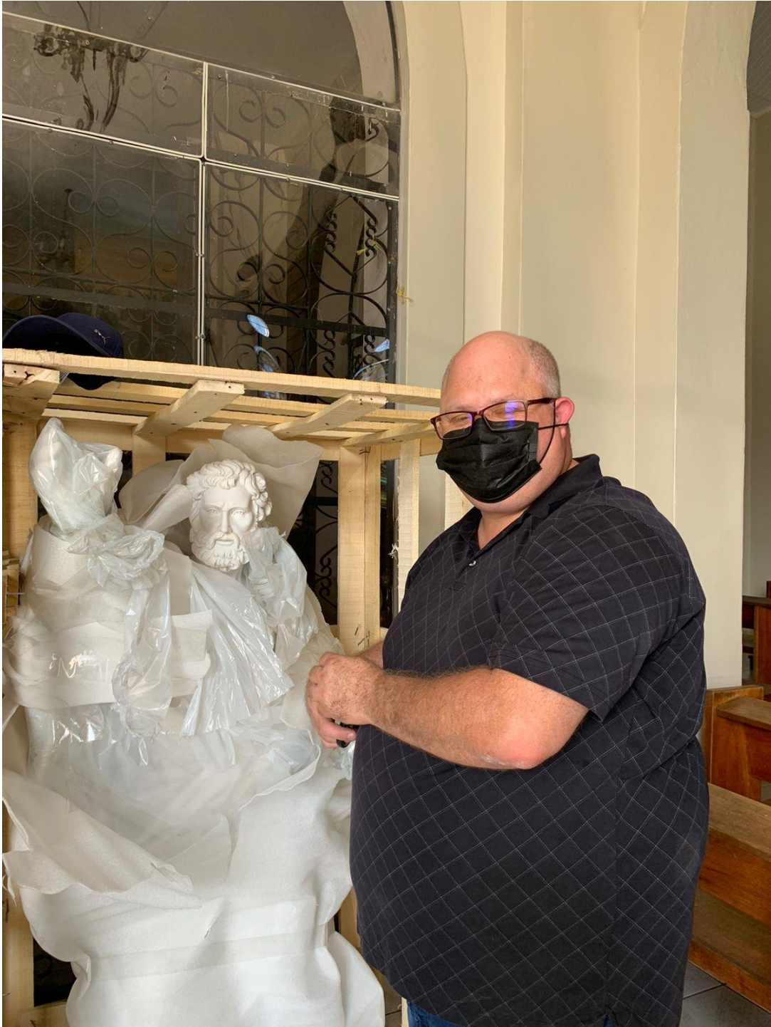
Adquisición de las Imágenes de Apóstoles Pedro y Pablo en Mármol, que serán instaladas en la fachada principal del Templo Parroquial (febrero 2022).