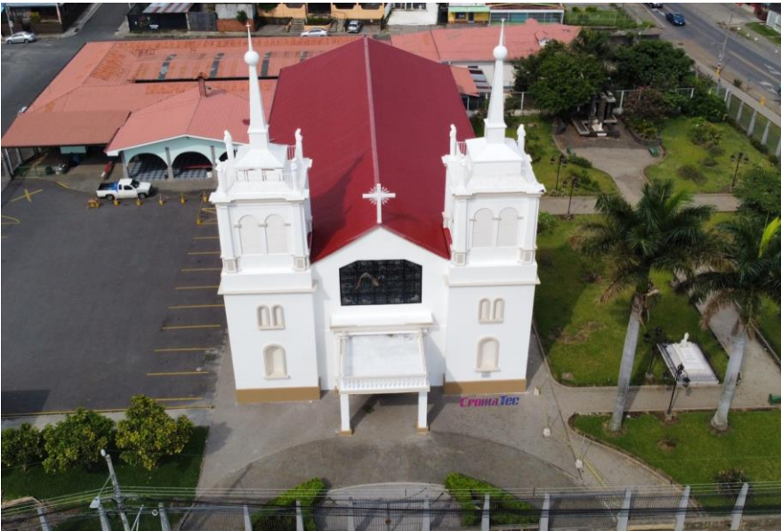
Trabajos de Pintura 2021