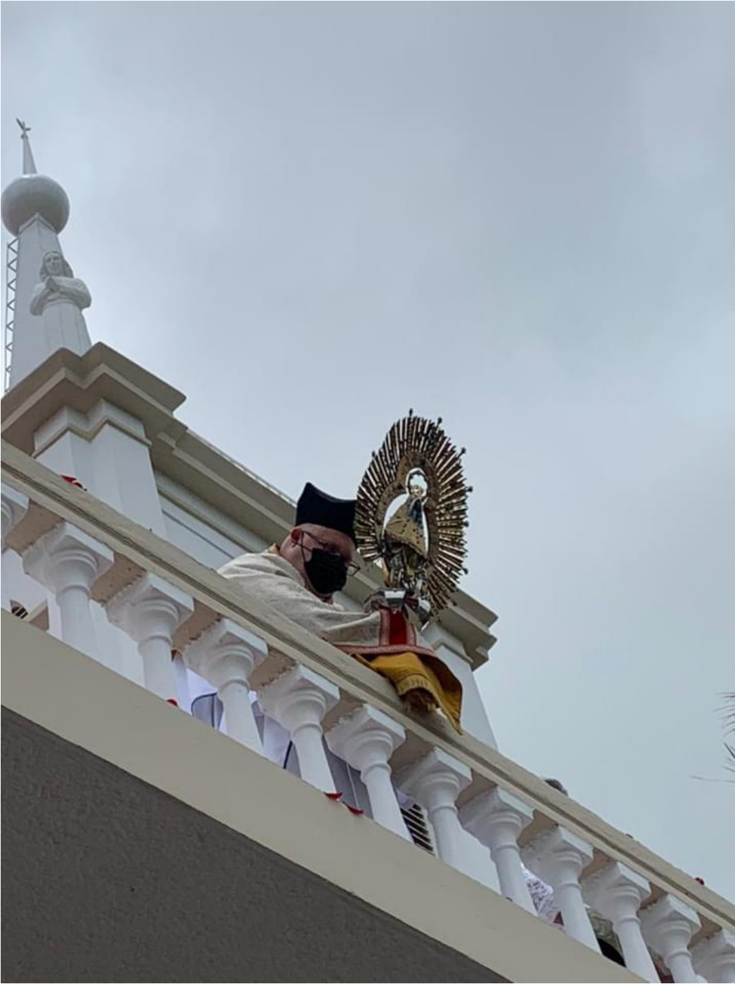
Celebración del 2 agosto del 2021.