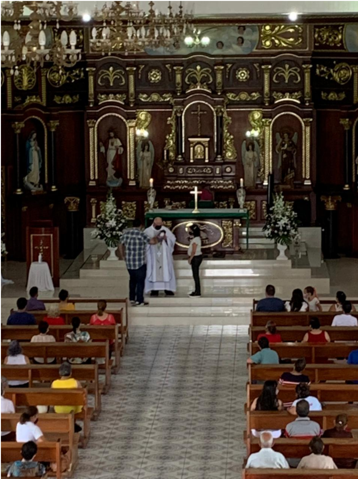
Celebración del 2 agosto del 2021